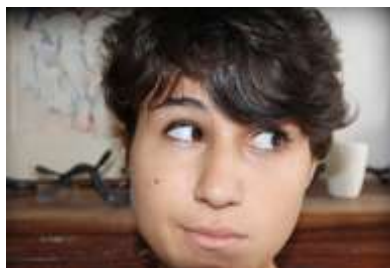
Portrait parcours 2016